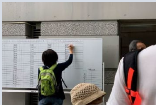
◀安否確認ボードを使用した訓練の様子